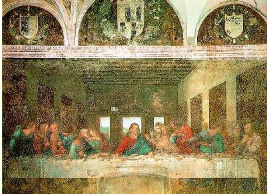
لیۆناردۆ داڤنشی، تابلیۆی دواشیۆ S/ Last Supper

هونەری ئەوروپی سەدەکانی ناوەراستی و رینسانس ٢٧٥